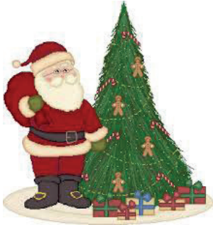
La fête de Noël

2 Quel est le sens de chacun des signaux suivants ?